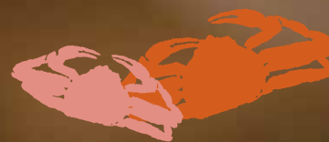
Kani Beer "Snow Beer"