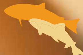
Weizen "River Beer"