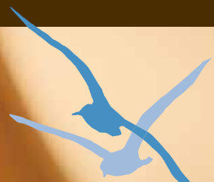
Pilsner "Sky Beer"