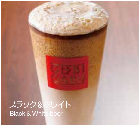
ブラック&ホワイト Black & White beer