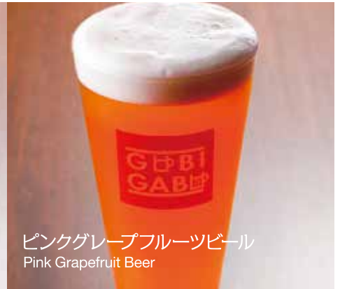
ピンクグレープフルーツビール Pink Grapefruit Beer